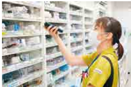
◀調剤監査システムを導入して、調剤ミスを防止しています

入院に関しては、飲み薬だけでなく注射薬も取り扱っており、こちらでも電子カルテで情報を確認しながら安全かつ正確に調剤をしています。入院中、ご自身でお薬の管理をされている患者様に対してはベッドサイドでお薬の説明をしています。その他、他職種連携の一環として院内の様々な会議や入院患者様の状況について話し合うカンファレンスなどに参加しています。組合員さんとの関わりとしては、班会に講師として呼んでいただき、お薬の話をさせていただくこともあります。