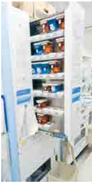
▲全自動錠剤分包機