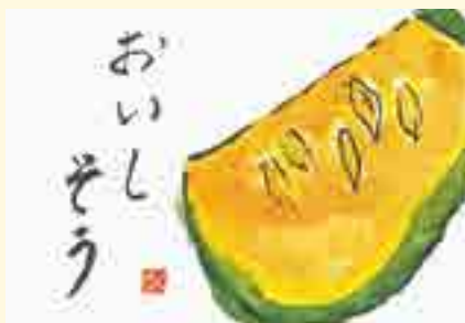
あぼし絵手紙サークル