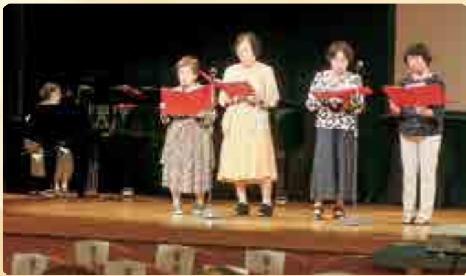
▲童謡を歌う会の「ジジババサンバ」に会場は大盛り上がり！ 短歌会とりかごの受賞作品紹介▶