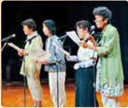
▲香寺支部は楽しい替え歌を披露♪ オープニングはシング・レフティーズ▶