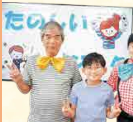
◀夏休みのいい思い出になったかな?