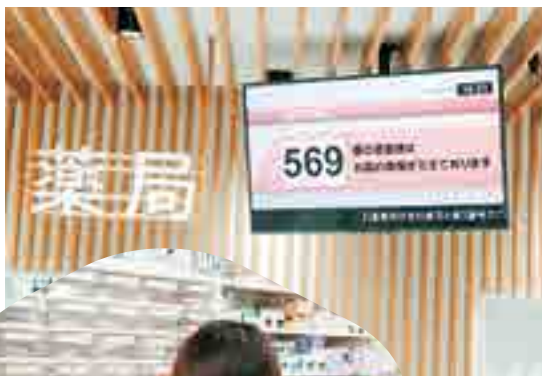
▶注射薬も管理しています