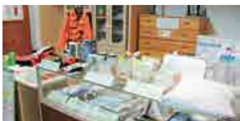
▲防災グッズも色々展示されています

9月1日の防災の日を前に『ひめじ防災プラザ』を訪れました。消防局が入る姫路市防災センター内に2007年開設した施設で、「見る」「知る」「体験する」ことにより防災に関する知識や技術を楽しく学ぶことが出来ます。