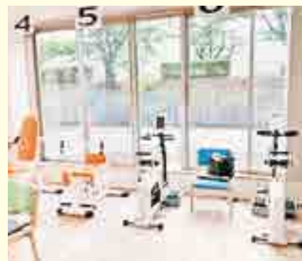
▲組合員さんも体験