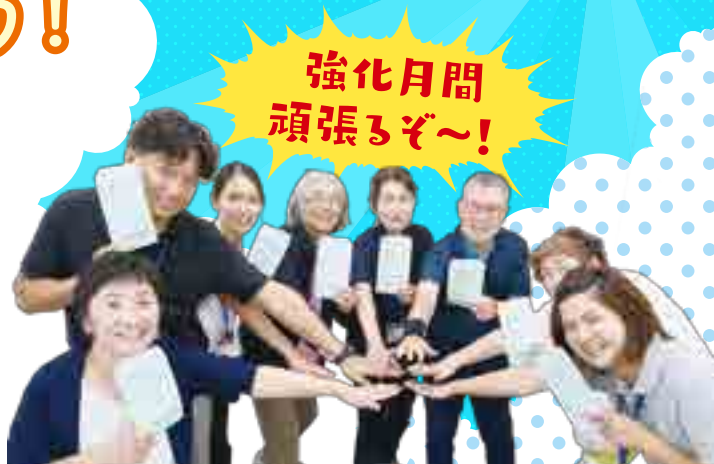
▲増資袋をご用意しています。増資のご協力よろしく願いします。

今年も秋の生協強化月間が始まります。期間は10月1日(火)から11月30日(土)です。地域のつながりを大切にしながら、多世代に姫路医療生協の存在をアピールし、助け合いや健康づくりの輪を拡げ、誰もが取り残されないまちづくりを進めていきます。組合員の皆様、ご加入のお誘いや出資金の増資など、ご協力の程よろしく願いいたします。