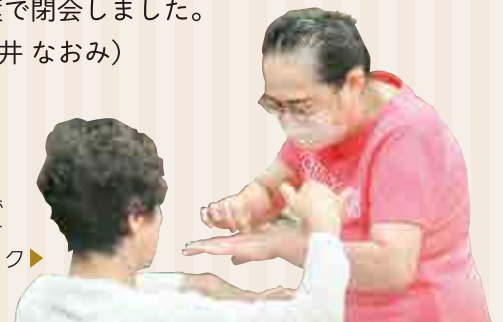
手の甲をつまんで脱水症状になっていないかをチェック▶