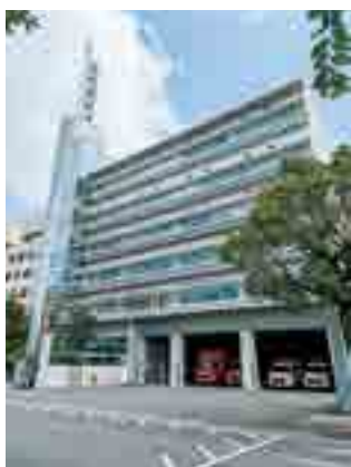
▲施設が入る姫路市防災センター

ひめじ防災プラザ 姫路市三左衛門堀西の町3番地 ☎079-223-1997 ※入館料は無料。10名以上の団体 利用、救急救命体験の利用は事 前予約が必要です