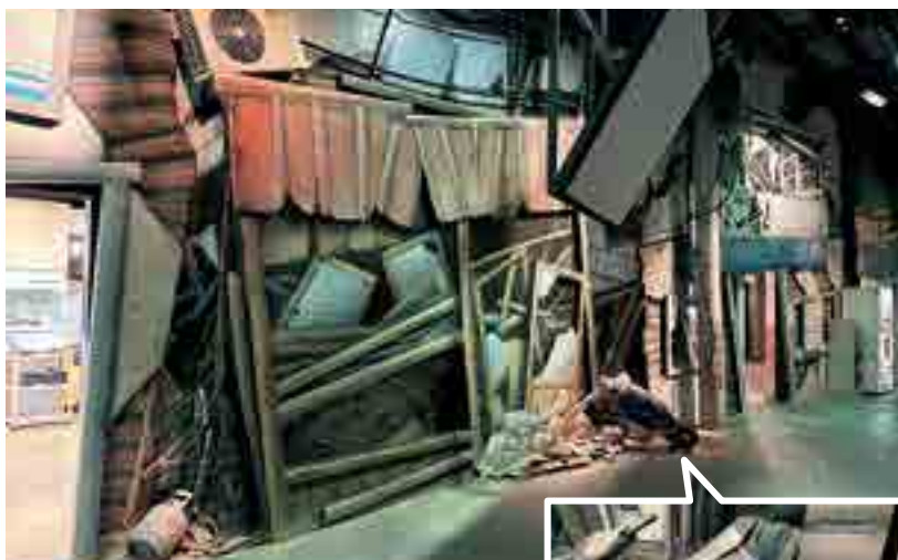
▶被災直後の街並みをイメージした広場

9月1日の防災の日を前に『ひめじ防災プラザ』を訪れました。消防局が入る姫路市防災センター内に2007年開設した施設で、「見る」「知る」「体験する」ことにより防災に関する知識や技術を楽しく学ぶことが出来ます。