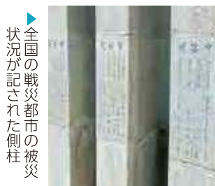
▶全国の戦災都市の被災状況が記された側柱