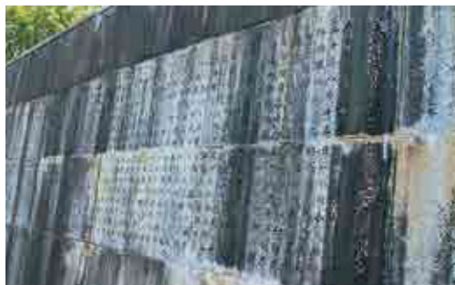
▲慰霊塔の背面に刻まれた国へのメッセージ