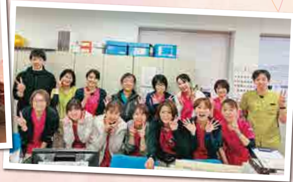
▲2階・訪問看護スタッフ

居宅介護支援事業所別所 ☎079-253-0620 訪問看護ステーション別所 ☎079-253-1135