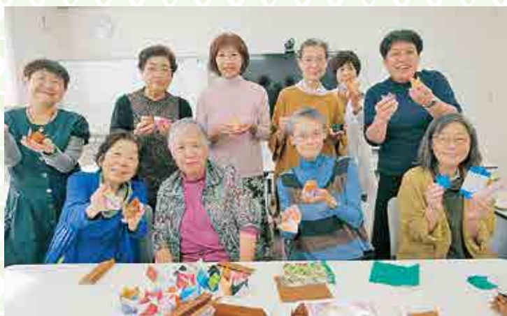
▲私たちと生きがいを見つけましょう

Q 2024年8月1日に姫路医療生協は創立50周年を迎えます。記念事業などは予定されているのでしょうか？ 黒岩…はい。法人として、11月に創立50周年記念式典&レセプションを開催予定です。2024年度は50周年記念事業を通じて、広く組合員・地域住民・他団体に姫路医療生協の事業と活動を発信し、多くの方にサービスをご利用いただ