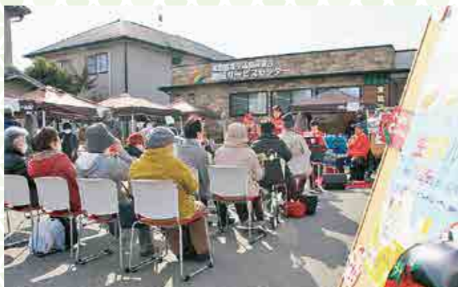
▲地域に根つき、広がる生協マルシェ

と思うことの実現に向けて、新しい組合員参加の形をつくっていきましょう。フレイル・オーラルフレイル予防活動や生協マルシェ、ボッチャ、認知症カフェ、生協10の基本ケアミニ交流会、サークル活動など、気軽に集まり「ゆるやかなつながり」をひろげていきたいと思います。