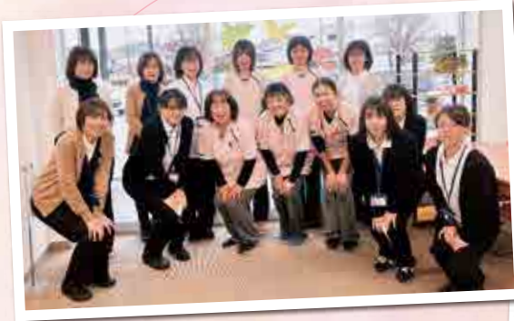
▲1階・居宅介護支援とヘルパーステーション 定期巡回・随時対応サービスのスタッフ