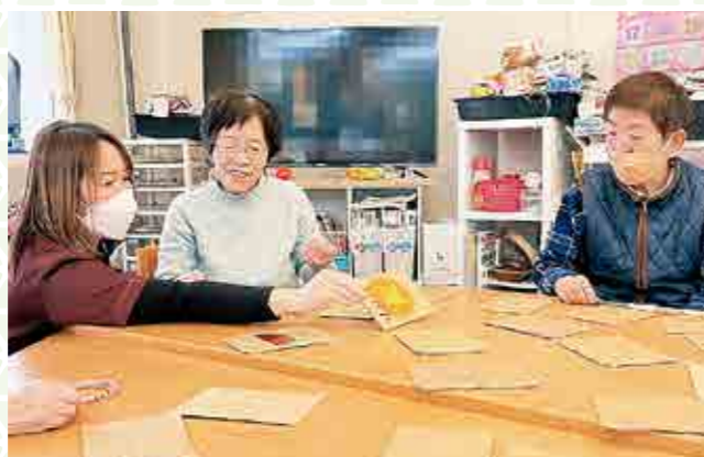
▲事業所でも生協10の基本ケアをすすめています

Q 最後に、これからの時代、医療生協の役割はさらに重要となってきますが、地域活動についてはどのように展開されますか？ 黒岩…「楽しく、おいしく、オシャレ」で多彩な活動を地域にひろげます。「楽しそう」「やってみたい」