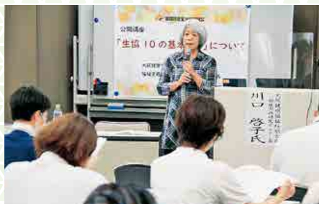
▲昨年8月の生協10の基本ケア学習会

黒岩…2023年度の最大のトピックスは、共立病院の建て替えリニューアルの大事業を成功させ、2023年12月18日に新病院（地域包括ケア病床48床）を開院したことです。患者さんから「共立病院がとても快適になった」と喜ばれています。さらに多くの組合員や地域住民のみなさんに「かかりつけ医」病院としてご利用いただければと思います。共立病院は