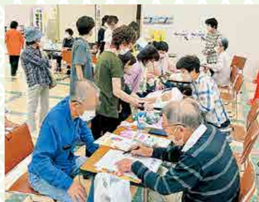
▲コープこうべ コープ龍野店での健康チェック

法人理念「その人らしく、気持ちよく生きる」の実現をめざし、高齢になっても、認知症になっても、障がいがあっても、住み慣れた地域・自宅でくらし続けられるまちづくり：地域包括ケアを推進します。また、統廃合を含めた事業の再構築・経営改善を計画的にすすめます。4月に福祉用具レンタルなどを福祉用具レンタル共立に統合するとともに、7月はショートステイついでが事業閉鎖となります。介護報酬のマイナス改定や介護職員の不足、赤字経営の継続等によるショートステイついで閉鎖は大変残念ですが、経営資源や人材を他の事業に集中させることが必要と判断し、今回の決定に至りました。