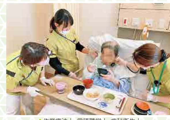
▲作業療法士、言語聴覚士、歯科衛生士、専門職による飲みこみ状態の確認

協10の基本ケア」を通して、くらしの安心ネットワークをひろげよう！です。「生協10の基本ケア」は、①尊厳を護る、②自立支援、③在宅支援を大切にされたケアの基本理念です。「生協10の基本ケア」を組合員と職員の「合言葉」に、事業経営・人材育成・組合員活動に活かし、くらしの安心ネットワークをひろげます。 具体的な事業展開としては、8月に共立病院デイケアを建て替えオープン予定です。定員も現在の23名から35名に増やします。