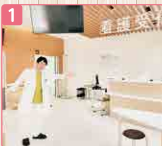
1 ▲まず、看護師から検査のご案内をします。そこから検査スタートです。