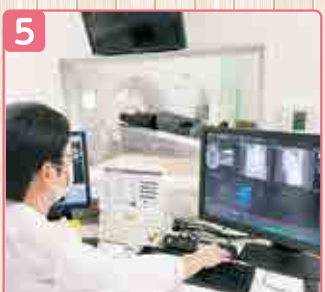
5 ▲操作室の様子です。最新のCTで、検査は安全第一で行っています。