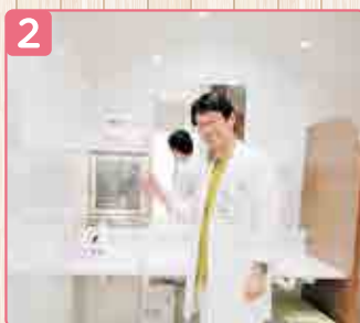
2 ▲検尿をとったらこちらの扉を開けて入れてください。