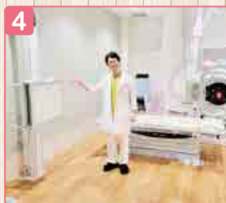
4 ▲部屋はコンパクトになりましたが、設備はとても良くなっています。