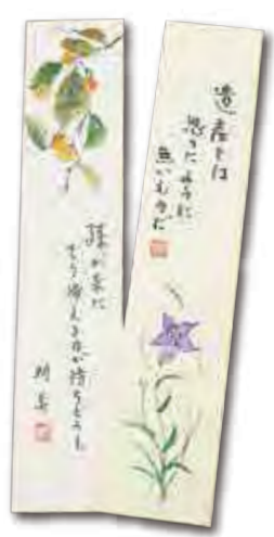
綾部さんの句。共感される方も多いのでは？