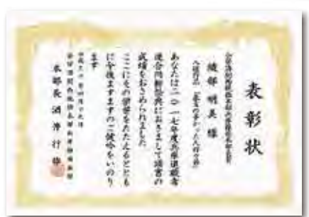
これまで様々な賞を受賞されています

光陰矢の如しとはよく言つたもので、皆さんと川柳の勉強を始めてからもう三年が来ようとしています。今ではキャッチボールをするような感覚で投稿され、こちらでもそれを楽しみに受け、読み、添削し、お互いに勉強してきました。最初は暗中模索の感がありました。最初は暗く、今では楽しみのなっております。そして同じ作者が、次作で上達されているのを見ると至上的喜びを感じます。どうぞ皆さん、一日一句を合言葉に楽しい人生をお送り下さい。有難うございました。うぐいすの