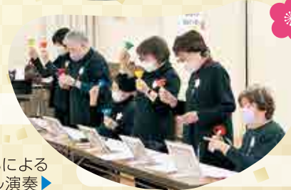
東第1支部によるハンドベル演奏▶