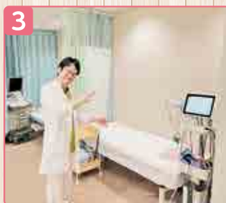
3 ▲心電図とエコー検査です。