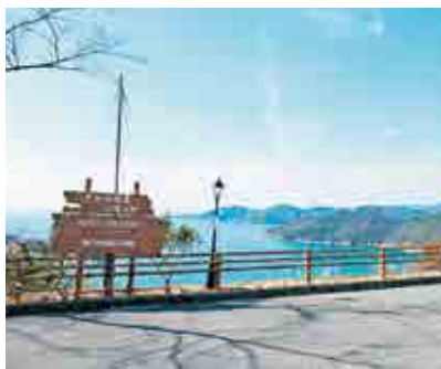
万葉の岬 相生市相生字金ヶ崎5321