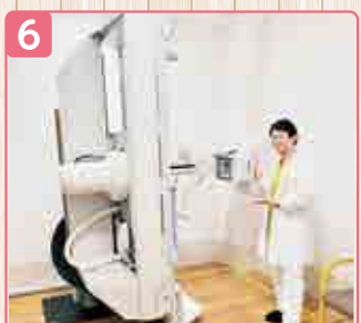
6 ▲こちらでは胃のバリウム検査や嚥下検査を行います。