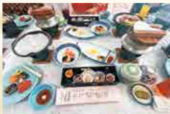
▲美味しい食事に舌鼓

参加者には、健康自慢、医療生協に関わったきっかけ、自分たちの班会企画等の紹介など個性的な自己紹介をしていただきました。中には手芸・絵手紙の得意な方もおられ、お互いに教え合えたらいいな。初対面同士でもすぐ打ち解けたようで楽しく会話が弾んでいました。