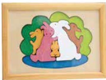
▲地域サービス部に飾ってある今年の干支ウサギ