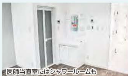
医師当直室にはシャワールームも