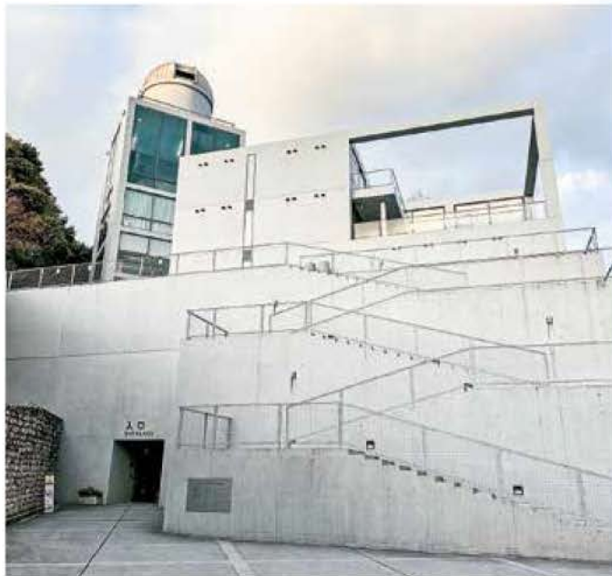
▼天体望遠鏡「あさひうら」 ▲世界的建築家 安藤忠雄氏がデザイン

● 組合員 18,100人 ● 出資金 409,863千円 ● 1人平均出資金額 22,644円 (2023年10月31日現在)