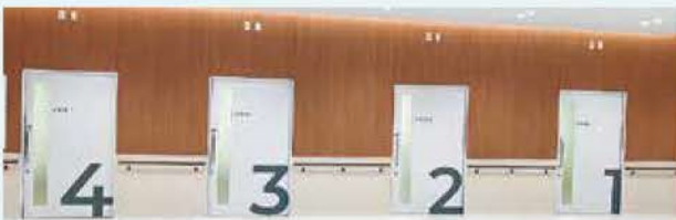
大きくて分かりやすい診察室の表示