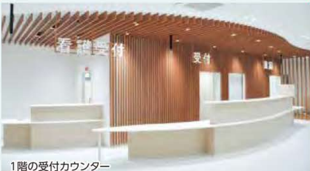
1階の受付カウンター