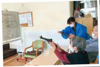
さあ、上手くのを狙って...