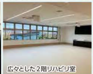
広々とした2階リハビリ室