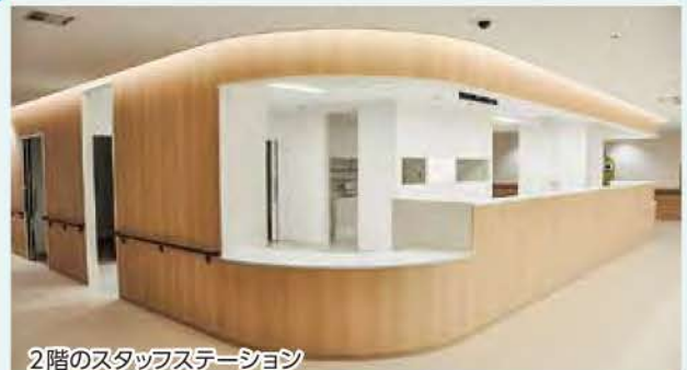
2階のスタッフステーション