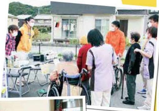
マルシェを楽しまれる利用者様