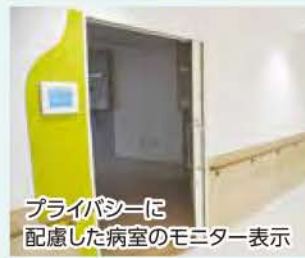
プライバシーに配慮した病室のモニター表示