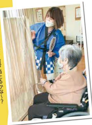
千本引き 何が当たるかな?

新型コロナやインフルエンザの蔓延がありますが、地域の方との触れ合いも大事にしていきたいと思いますので、また地域の方にもご参加いただけるイベントを行っていきたく考えております。