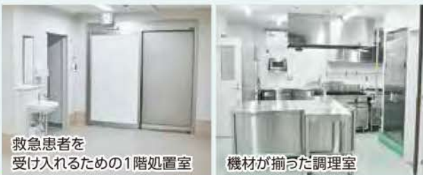
救急患者を受け入れるための1階処置室