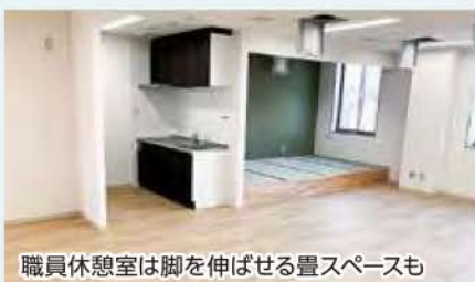
職員休憩室は足を伸ばせる畳スペースも