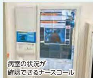
病室の状況が確認できるナースコール