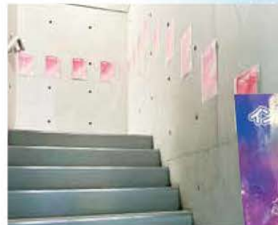
◀階段には季節ごとの星座のイラストが

星の子館は、1992年に開設した宿泊が出来る児童館です。姫路市立の施設ですが、指定管理者制度により現在は神姫バス(株)が運営しています。 「子どもの記憶に残る体験を提供する場」をスローガンとして、毎月のイベントはもちろん、建物の中にも楽しめる工夫が施されています。大人だけの利用も可能です。 本館の最上階には天文台があり、兵庫県で二番目に大きい天体望遠鏡『あさひうら』で毎晩(休日は昼も)天体観望が出来ます(※11月から来年3月15日までは改修工事のため、代わりに小型望遠鏡や双眼鏡で観望します)。天体観望会は専門スタッフによる丁寧な解説で小さいお子様にも人気です。また、スマホで月を撮影するイベントなどが時折おこなわれています。 今回、専門スタッフの蓮岡さんに冬の星空の見どころを伺いました。「南の空には土星と木星が、東の空には冬を代表する星たちが明るくて見つけやすいです」。 天体観望会以外にも色々な楽しみ方が出来る星の子館。童心に帰り自分なりの楽しみ方を見つけてみてはいかがでしょうか。 (取材・地域サービス部 藤木 祐弥)