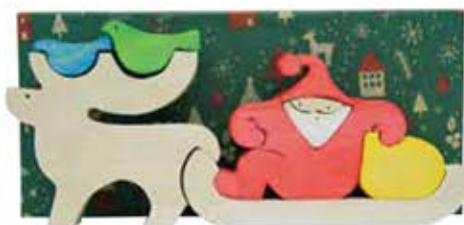
▲クリスマス仕様の木工細工