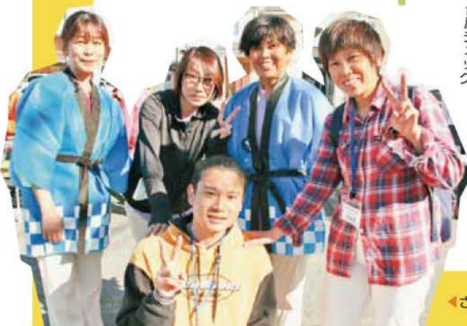
さろおのスタッフもマルシェに参加