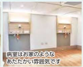
病室はお家のようなあたたかい雰囲気です