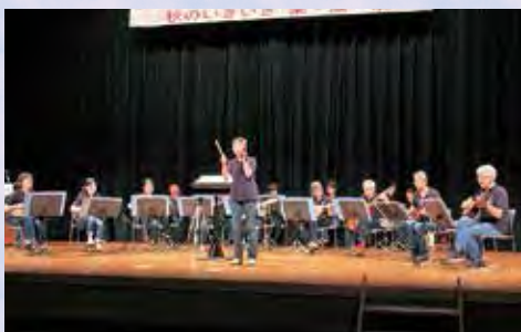
▲『アンサンブル・マーガリート』によるマンドリン演奏