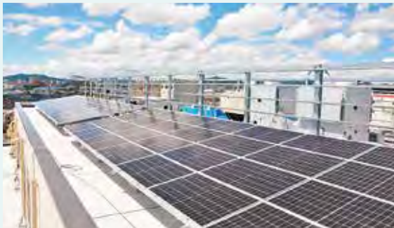
▲太陽光発電でSDGsにも貢献