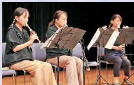
▲『ひめリコ』のリコーダー演奏