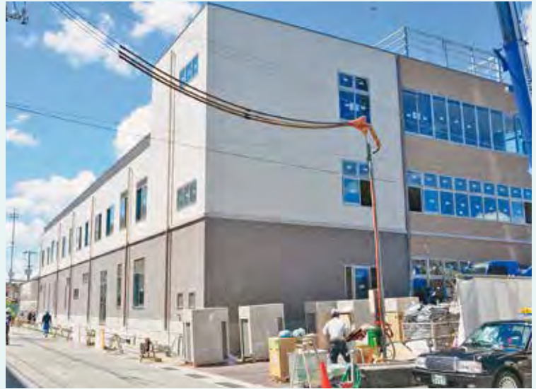
▲全てのシートが外れ全貌がわかるようになりました

天井や壁の設置とクロスなどの内装工事もすすんでおり、8月末の工事進捗率は70%へ達しました。廊下幅の基準が現病院よりも広くとられているためか、2階病棟に入ると非常に開放