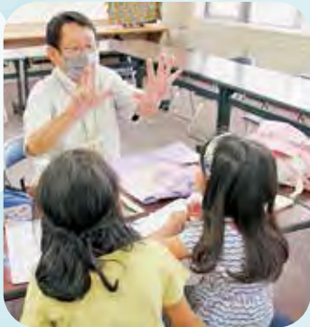
▲熱心に聞き入る子どもたち