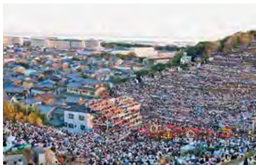
▲来場者でびっしり! とてもスケールの大きな祭りです

『灘のけんか祭』とも呼ばれる松原八幡神社の秋季例大祭。毎年10月14日・15日に行われ、三基の神輿をぶつけ合わせる神事『神輿合わせ』と、旧七ヶ村(木場・八家・東山・宇佐崎・中村・松原・妻鹿)の絢爛豪華な屋台が激しく練り競う勇壮な屋台練りが見どころです。