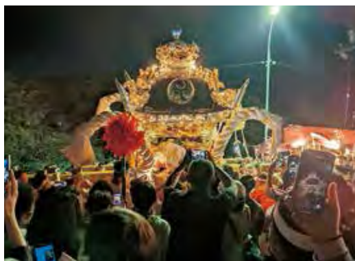
▲夜はライトアップで一層きらびやかに