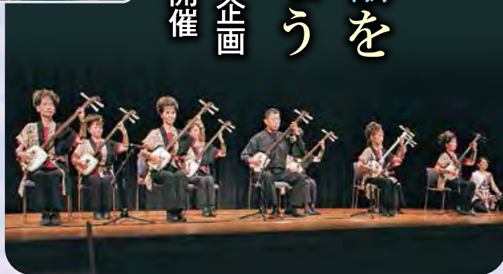
▲『訓夢会』による津軽三味線

第1部の最後は、原水爆禁止世界大会(長崎)の報告です。参加した職員から被爆者の声や戦争の記憶などが紹介され、平和の大切さを改めて考える機会となりました。