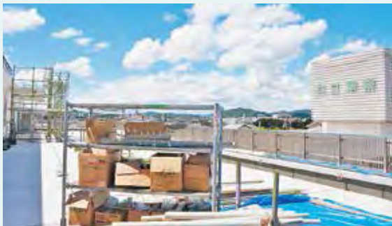
▲3階テラスから見る現・共立病院