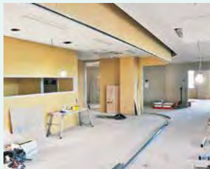
▲2階病棟ナースステーション