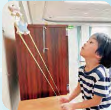
▲のぼり人形で楽しく遊んでいます

「見て見て～」とスタッフに駆け寄る姿や、かわいいドライフラワーと組み合わせでお母さんとリースを作る姿に、ボランティアさんからも「やっぱり子どもが元気な姿を見ると嬉しいね」との声をいただきました。