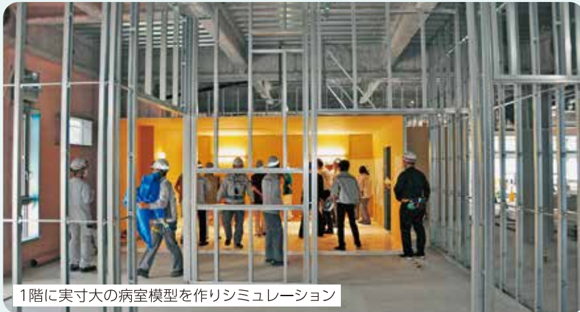
1階に実寸大の病室模型を作りシミュレーション

何か見落とししていないか確認に時間はかかりますが、みんなにとってよい病院にするために尽力していきます。