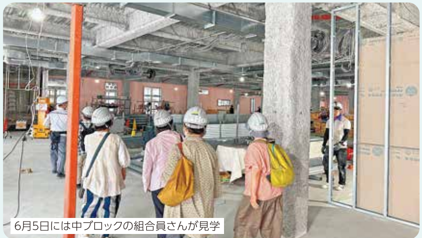
6月5日には中ブロックの組合員さんが見学