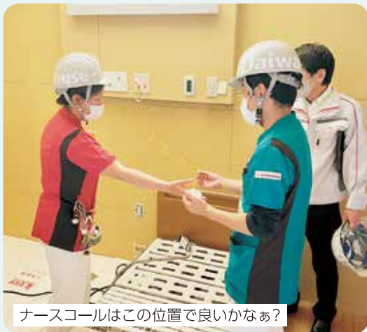
ナースコールはこの位置で良いかなあ？