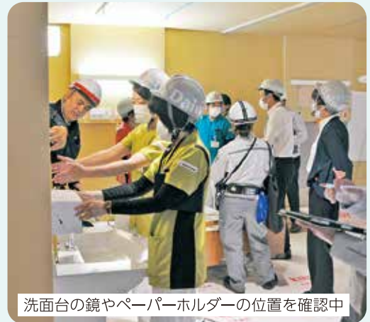
洗面台の鏡やペーパーホルダーの位置を確認中