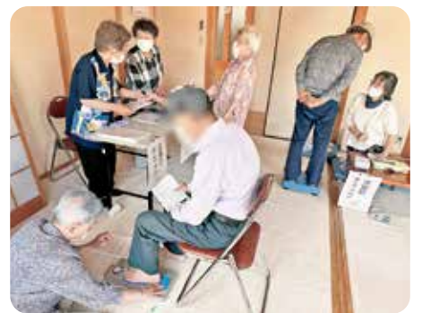
▲同日、「夢前川 川まつり」でも広畑・八幡支部が健康チェックを開催しました

クを受けていただきました。やはり一番人気は骨密度測定でした。有料(200円)ですが、手首で手軽に測定できるのが魅力のようです。握力も人気で、普段家であまり