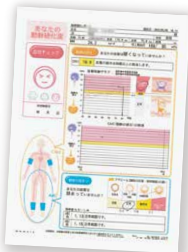
血圧脈波の検査結果用紙。カラーでとても見やすくなりました。

を繰り返していただくので、このタイミングで新しくしました。どの検査機器も、より小型化しているだけではなく、測定時間も短くなり、結果の待ち時間も短縮されます。