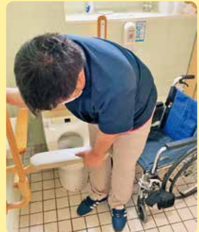
▲できる範囲でひとりで乗り移りしましょう