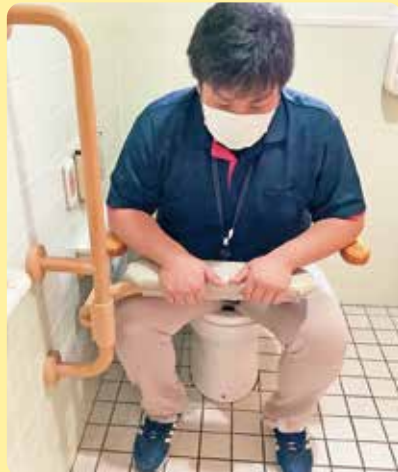
▲手すりがあれば座位が不安定な方でも安心して座っていただけます