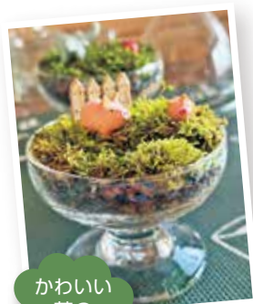
かわいい苔のテラリウム