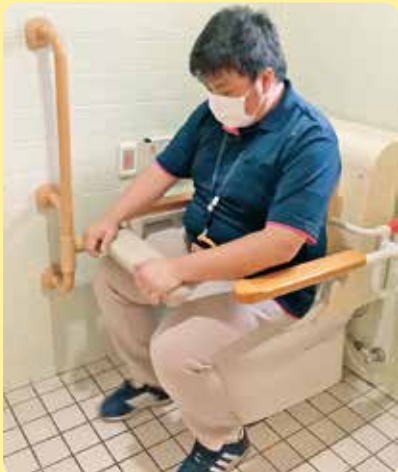
▲ひとりでトイレに座りましょう