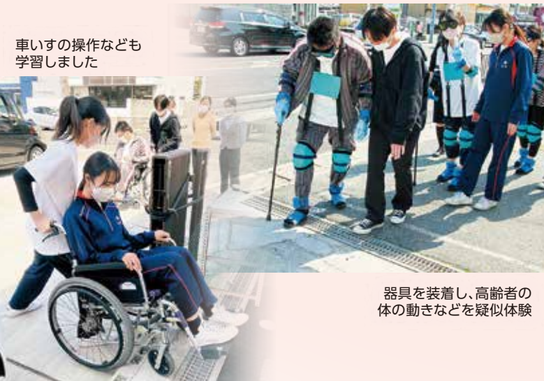
車いすの操作なども学習しました