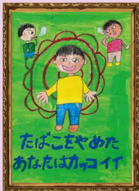
最優秀賞 かめい えま 亀井 愛真さん(城乾小4年)