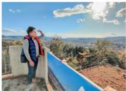
▲展望台からの風景