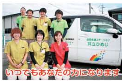
いつでもあなたの力になります

これらの骨盤運動は老若男女問わず効果的ですが、毎日続ける事、正しく行う事がとても大切です。 1人では継続が難しい、このやり方で合っているのだろうか？そんな方はぜひお近くのリハビリスタッフにご相談ください。 訪問リハビリでは、コロナ禍でも、あなたの運動機会の提供と心身の健康を支え続けます。