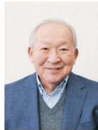
姫路医療生活協同組合 代表理事・理事長