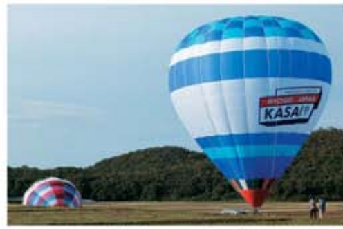
▲みんなの希望をのせ大きく膨らむ気球

加西市と言えば県立フラワーセンターや五百羅漢、北条の宿など見どころの多い街ですが、気球の飛行地としても有名なのをご存知でしょうか？ 加西市には台地上の平野が広がり、上空には穏やかに安定した風が吹くなど気球の飛行に適した環境が揃っていることから、平成26年頃より全国各地から気球チームが訪れるようになりました。平成28年の「第22回全国熱気球全日本学生選手権」の加西市開催を機に、「気球の飛ぶまち加西」として全国へ発信しています。 加西市では11月から5月までを飛行シーズンとしています。毎年シーズン入りの際には、空の安全を祈願する「ソ