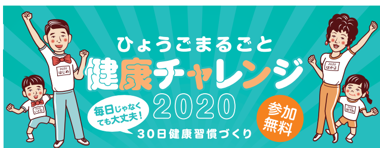
▲今年もやります! ひょうごまるごと健康チャレンジ!

底して取り組まれています。コロナ禍以前と状況は大きく変わりましたが、感染に十分気を付けながら、楽しくつながりを広げていきましょう。2020年度生協活動のストーリーガンは「誰一人取り残さない社会の実現」です。地域で困っている方はいませんか? お一人の方がいれば、お互いに声をかけてみませんか? つながりを大切に、新型コロナに負けない強化月間にしていきましょう!