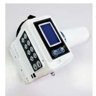
◀ポータブルのレントゲン

「持病があり通院が難しい」「施設や病院に通院できない」など、お口の悩みを抱えつつも歯科へ来院することが難しい方はいらっしゃるいませんか? 共立歯科では、そんな悩みにお応えするため通院困難な方へ往診によるサポートを行っています。今回はその内容をご紹介します。共立歯科の往診では外来同様の治療が行えるよう器具機材を揃えており、唾液や水もバキュームで吸引しながら丁寧ケアしています。虫歯の治療はもちろん、義歯作製、抜歯など様々な治療に対応しています。さらに口腔外科・補綴