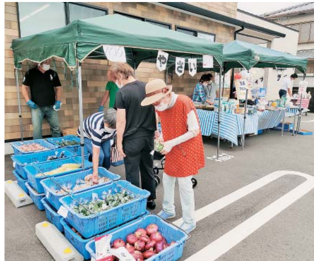
▲新鮮やさいも好評でした！

第1回目の今回は新鮮野菜の販売や平和バザー、フードドライブ、介護相談という内容でした。朝から蒸し暑さが増す中、小さなお子さま連れのお母さんやお散歩途中の方など45名が来場。みなさまには新型コロナウィルス感染拡大防止対策として、名簿の記入やマスクの着用、体温測定にご協力いただきました。また、密集を避けるため整理券順の入場制限も行いました。