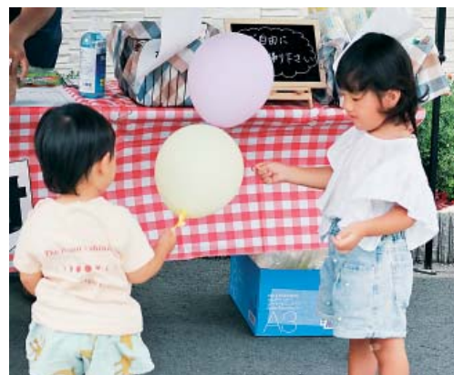
▲子どもさんには風船のプレゼント

た新鮮野菜を求めて開店前から賑わいを見せました。同じく平和バザーも掘り出し物を求める方々で賑わいました。バザーの収益は今後の平和活動に活用されます。フードドライブも多くの方に協力いただき約40点の食品が集まりました。みなさんの両手には野菜とバザー用品が、お顔は笑顔で溢れていたのが印象的でした。