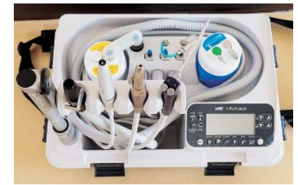
▲1台で歯を削ったり歯石の除去が可能

「持病があり通院が難しい」「施設や病院に通院できない」など、お口の悩みを抱えつつも歯科へ来院することが難しい方はいらっしゃるいませんか? 共立歯科では、そんな悩みにお応えするため通院困難な方へ往診によるサポートを行っています。今回はその内容をご紹介します。共立歯科の往診では外来同様の治療が行えるよう器具機材を揃えており、唾液や水もバキュームで吸引しながら丁寧ケアしています。虫歯の治療はもちろん、義歯作製、抜歯など様々な治療に対応しています。さらに口腔外科・補綴