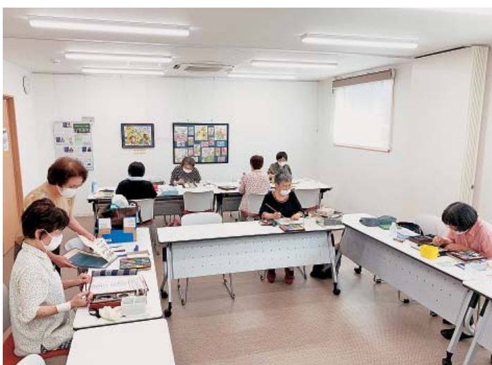
感染予防を徹底して活動再開!!

サークルでは、4力月ぶりの再会にみなさん近況報告からのスタート。どのサークルもソーシャル・ディスタンスを保ちながら参加者名簿の作成と換気、また体温測定・手洗いなど感染予防対策を徹