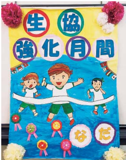
工夫を凝らして取り組みます(昨年の福介など)

金増資は、月間終了時に今年度目標(1000人・3千万円)の8割到達を目標とします。今年度はコロナ禍での強化月間となるため3密の回避、感