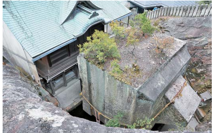
▲横倒しのままの宮殿という説もある石乃宝殿

石乃宝殿は水面に浮いているように見えることから別名浮石とも呼ばれています。二柱の神様が守るこの地は、パワースポットとしても人気の高い場所となっております。