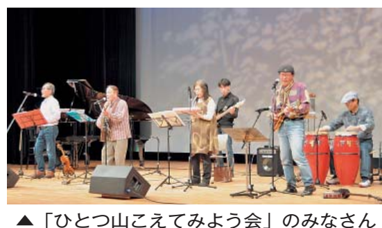
▲「ひとつ山こえてみよう会」のみなさん

また、自宅で亡くなった方の約半数はかかりつけ医による死亡診断書がなく、死体検案（遺体を確認して死因を判断すること）となつていることに触れ、「死ぬことは人生の延長線上の結果で誰も逃れられないものではありませんが、既に呼吸が止まっても慌てて救急車を呼ばず、かかりつけ医に連絡しましょう」と、かかりつけ医を持つ