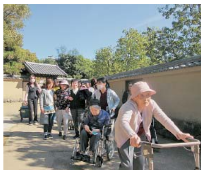
▲さあ、好古園散策に出発

当日は曇りつつない快晴、絶好の行楽日和でした。日頃は屋内生活で外出の機会が少ない利用者様も、この日はオシャレをしてお出かけです。送迎車に乗り込んだら、さあ出発。車の中で