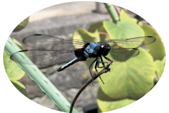
▲シオカラトンボもお忘れなく