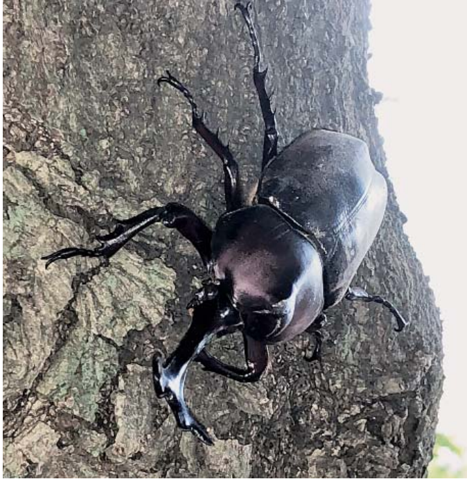
▶甘い樹液はどこかな？