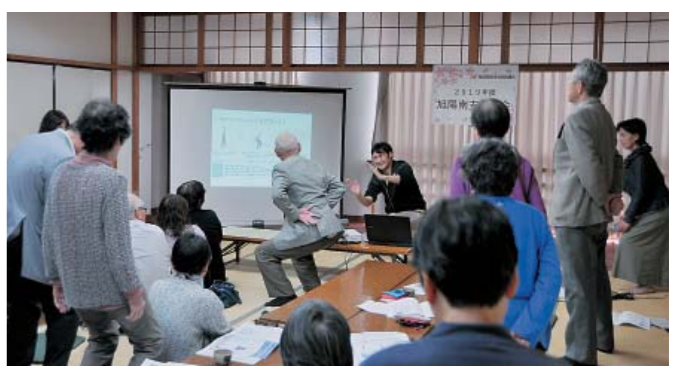
▲総会第2部フレイル予防講座 (旭陽南支部)

お一人お一人の、我が家で生きるといふ気持ちを大切に、チームで在宅療養を支え、思いやりのあるサービスを提供できるよう日々努力します。