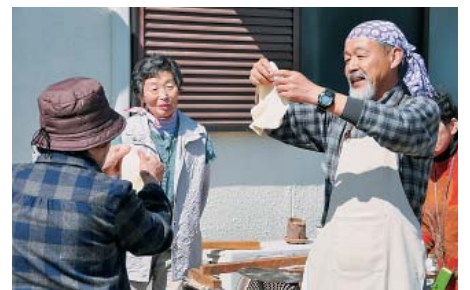
▲ピザ生地の伸ばし方をレクチャー