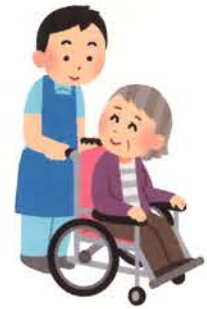
1 訪問看護ステーション 共立ひめじ