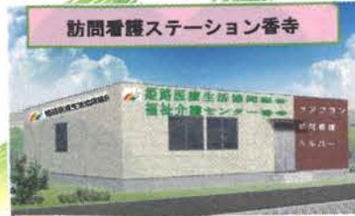
訪問看護ステーション香寺