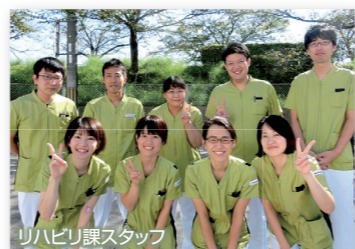
リハビリ課スタッフ

リハビリテーション部門では理学療法士・作業療法士・言語聴覚士による日常生活を重視したリハビリに加え、創意工夫をこらしたレクリエーションも取り入れております。