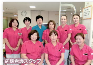
病棟看護スタッフ

看護部では「地域に根ざし、心かよいあう看護・介護を実践する」を理念とし、在宅介護スタッフとも密に連携し切れ目のない看護・介護サービスを提供しております。